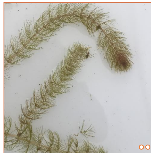
○○ Tige et myriophylle indigène