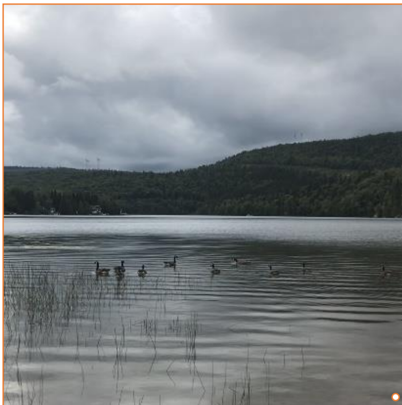
○ Vue du lac et de la faune présente lors de l'atelier d'identification

Au lac Saint-Sébastien, notre équipe a identifié 27 espèces , soit 4 plantes flottantes , 11 plantes émergées , 8 plantes submergées et 2 organismes aquatiques . La patrouille a été effectuée sur l'ensemble du périmètre du lac, où six herbiers principaux ont été délimités. Le plus grand herbier couvre la partie nord du lac et est partagé sur cinq secteurs du lac (1, 2, 4, 6 et 7). De plus petits herbiers longent la rive ouest du lac. Enfin, on compte trois herbiers dans les secteurs 9, 10 et 11 et un dernier à proximité de l'île contenue dans le lac. De plus, 2 espèces de plantes exotiques envahissantes ont été observées. Notons que le secteur 6 inclut une portion du cours d'eau à l'exutoire du lac.