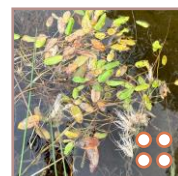
○○○ Tiges et Feuilles d'un potamogeton à feuilles submergées linéaires