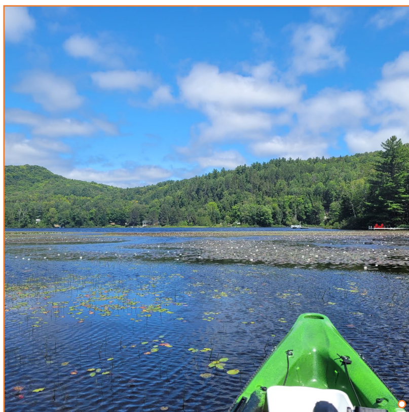
○ Vue du lac Blondin lors de l'atelier d'accompagnement

Au lac Blondin, notre équipe a identifié 32 espèces , soit 4 plantes flottantes , 10 plantes émergées , 14 plantes submergées et 2 organismes aquatiques . La patrouille a été effectuée sur l'ensemble du périmètre du lac, où un herbier a été délimité. Cet herbier couvre l'entièreté des rives et touche à tous les secteurs du lac. De plus, 1 espèce de plantes exotiques envahissantes a été observée.